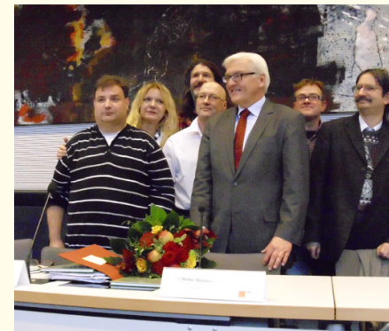
Frank-Walter Steinmeier (vordere Reihe, Mitte) war mit dabei.