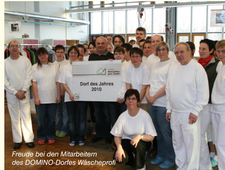
Freude bei den Mitarbeitern des DOMINO-Dorfes Wäscheprofi