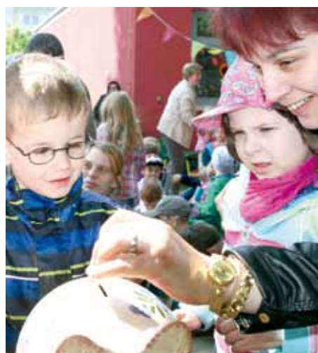
Abgefüllt: Spenden für neue Projekte wanderten ins Sparschwein.