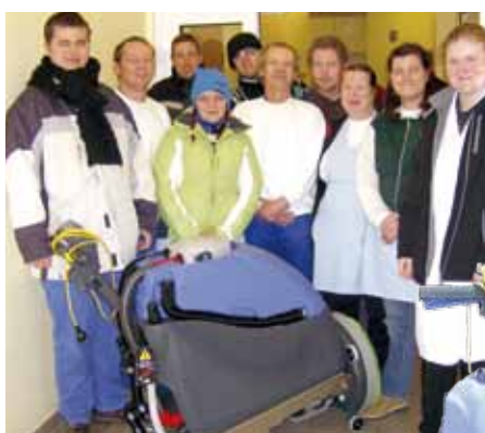
Das beste Stück: Die Saug-/Kehrmaschine „Numantic“ ist eine wertvolle Hilfe. Bald kommt sie im neuen Werkstattgebäude zum Einsatz.

Wir werden die Maschine ab Mitte des Jahres noch besser ausnutzen können. Dann nämlich ist das neue Werkstattgebäude fertig. Es ist sehr groß und auch die Flure sind dementsprechend größer als in der „alten“ Werkstatt.