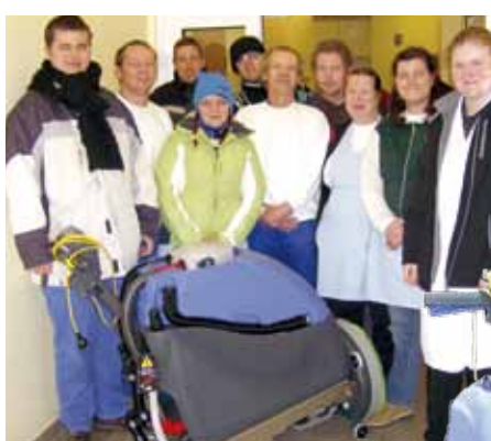
Das beste Stück: Die Saug-/Kehrmaschine „Numantic“ ist eine wertvolle Hilfe. Bald kommt sie im neuen Werkstattgebäude zum Einsatz.

Wir werden die Maschine ab Mitte des Jahres noch besser ausnutzen können. Dann nämlich ist das neue Werkstattgebäude fertig. Es ist sehr groß und auch die Flure sind dementsprechend größer als in der „alten“ Werkstatt.