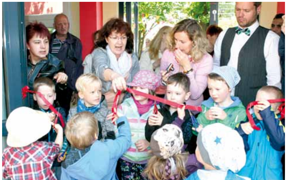
Endlich geht es los: Zehn Kinder durchschneiden gemeinsam das Band und machen den Weg frei zum neu gestalteten Innenhof.